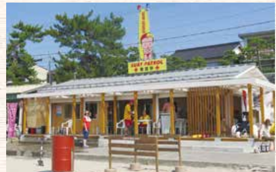
高浜町マスコットキャラクター「赤ふん坊や」